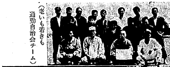
婦人バレーボールに 亀小母の会優勝 (県知事杯を手によるこびの 亀田小学校母の会チーム)

さる六月八日の「県民スポーツの日」は、亀田町でも午前六時からの歩け歩け運動をかわりに、サイクリング大会、婦人簡易バレーボール、ソフトボールの四種目が行われました。