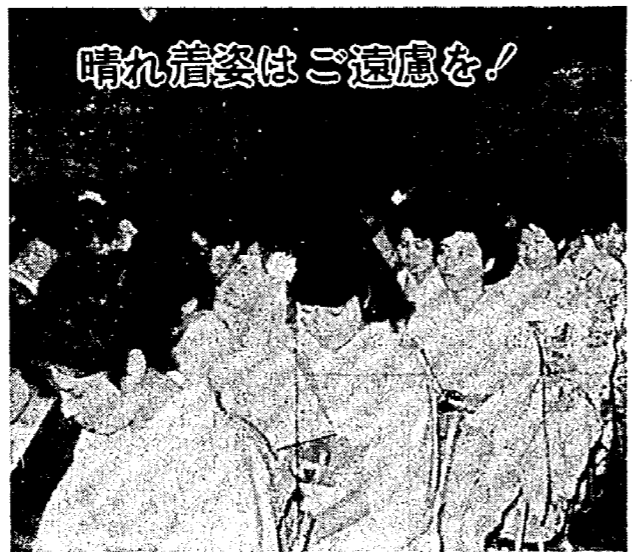
晴れ着姿はご遠慮を!

一月十五日の成人式は、ご数年晴れ着姿がくつと目立つようになりました。成人式には特に女子の晴れ着は「親は着せたいし子は着たい」これは人情かもしれせん。しかし晴れ着をつくりたくともつくれない人への思いやりがあつたら自粛に協力をと、町公民館では呼びかけています。 昨年の成人式は、ミズレ模様のお天気がつたこともあつて「あんな日でも成人式に参加するには晴れ着でないといけないのでしょうか」といってました。 その親は無理して子のために晴れ着をつくらせてやりにあつたにせよ、晴れ着をクリーニングに出さなければならぬ。三着行きの着が全額負担するのになつておられるからと云うのが主な理由と思ひます。 被保険者証で治療を受けられる。被保険者証を提示して治療を求めた場合に、保険医負担すること