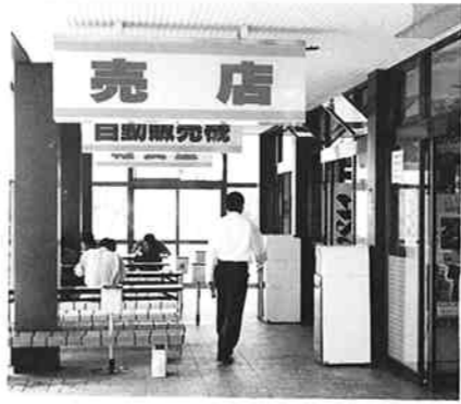
▲売店の休憩ホール