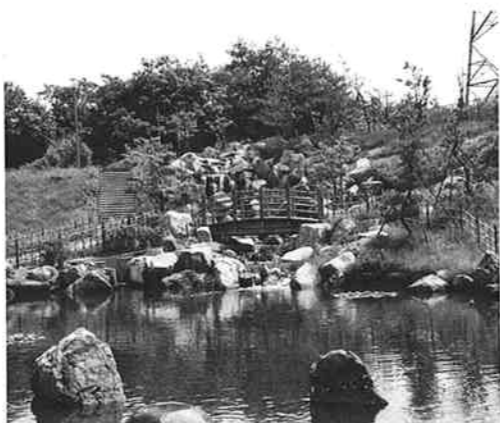
▲四季おりおりの景色をみせる公園

平成五年九月十九日、「道の駅」豊栄の開駅を記念して設置されました。市内のみどころ等をイラストマップで紹介しています。