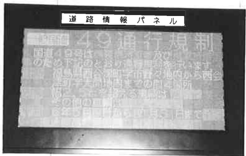
▲分かりやすい情報パネル

災害、工事、異常気象等による通行規制や通行注意などの道路情報をはじめ、各地の気象情報を電光文字のほか図や絵を交えて詳細に表示します。