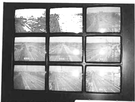
▲九つの画面があるマルチビジョン