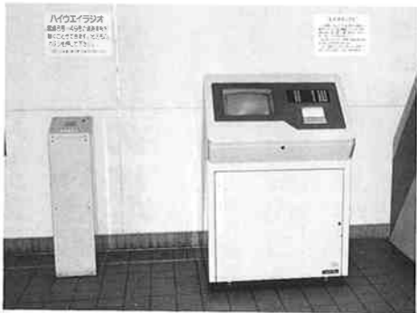
▲ハイウェイラジオとビデオテックス

なお、これらの情報はプリントアウトすることが可能で、情報を車内に持ち込むことができます。