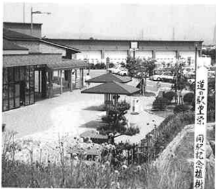
▲あずまやのある休憩所

休憩所および道路情報ターミナルと直接結ばれたトイレは、団体客も十分に利用できる規模で、身障者用も設置されています。また、公園内にもトイレが設置されています。