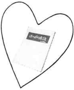
「地域の心」をつなぐ ほのぼの通信

の紹介や川柳コーナーなど、身近なテーマを面白く編集してあります。編集委員は30〜40歳代の主婦を中心にして、全くのボランティアですが、実に生き生きと楽しく取り組んでいます。 比較的古くからある町内で、世帯数も減少傾向にあります。他所から嫁いで来た方々や、この町が「ふるさと」となる子供達のためにも、「大人たちの怠慢やエゴは許されたいのではないか？」という思いが広がっています。 同じ地域に生活しているのは何かの縁、どうせ暮らすのなら、気持ち良く、明るく楽しく暮らしたい。そのためには、それぞれの立場で何ができるのかを考えるような雰囲気になってきているようです。 自治会活動というと、半強制的なものという印象がありますが、上大口では、いろんな世代の人達が、みんなの興味や関心と呼び起こそうと、知恵を出し工夫しあうことを、積極的に取り入れています。 みんなで知恵を借りながら活動を進めてきましたが、他の自治会との交流なども望んでいます。 連絡先 横山 387-2052