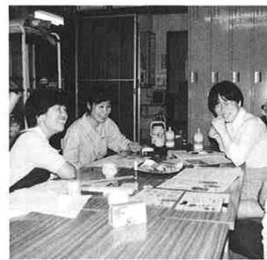
▲和やかな編集会議

「ほのぼの会館」 上大口自治会の公民館の正式名称なんです。町内から一般公募して決めた名前です。採用されたのは小学校4年生の女の子の作品でした。 この「ほのぼの会館」が完成して2年。町内の「ホットステーション」として様々な部会やグループが利用しています。また、ほのぼの会館運営委員会が組織され、各部会と自治会の代表が集まり、情報交換をして、お互いに刺激し合いながら活動が活発化しています。その運営委員会の最大の事業として『ほのぼの通信』という町内ミニコミ誌を発行しています。町内のニュースや行事などを中心に、新入学児童