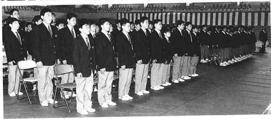
◀新1年生を迎え、初めての入学式。新しい制服がかっこ良く似合っています。