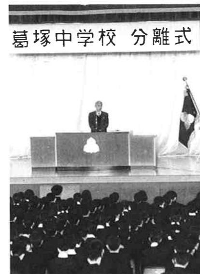
▲光晴中へ通う友と別れの分離式