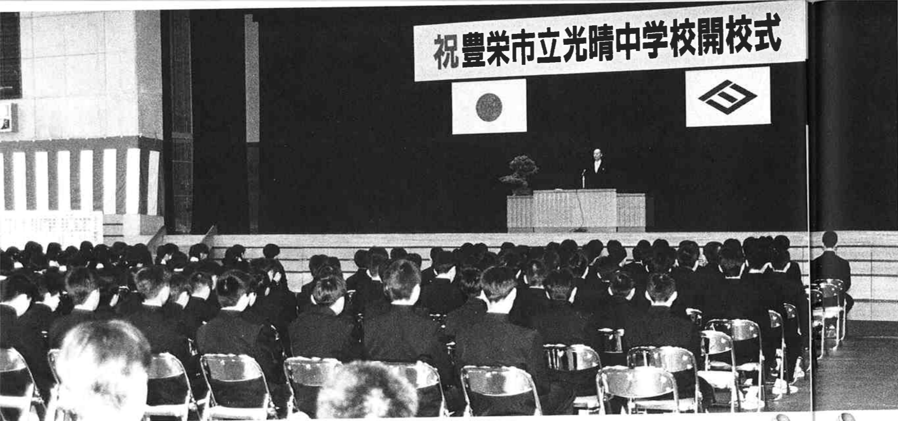
▲2・3年生が出席し開校式。「すばらしい学校に」と激励のあいさつを受けました。