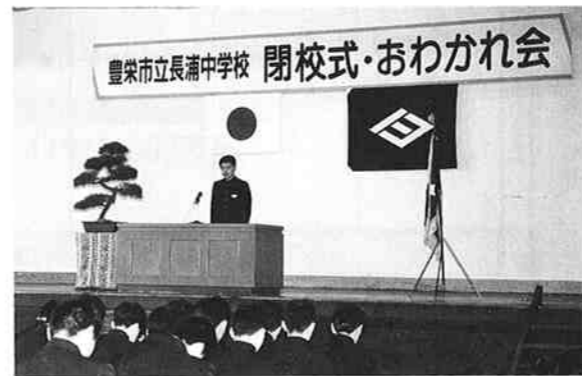
▲思い出を振り返り長浦中閉校式