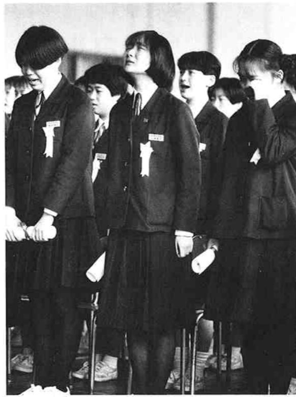
▲長浦中最後の卒業式