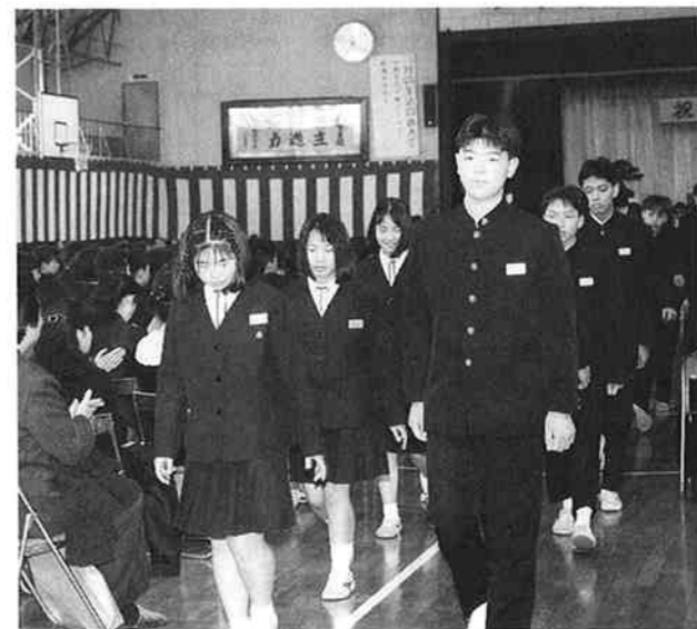
▲分離を前に、卒業生354人の葛中マンモス卒業式