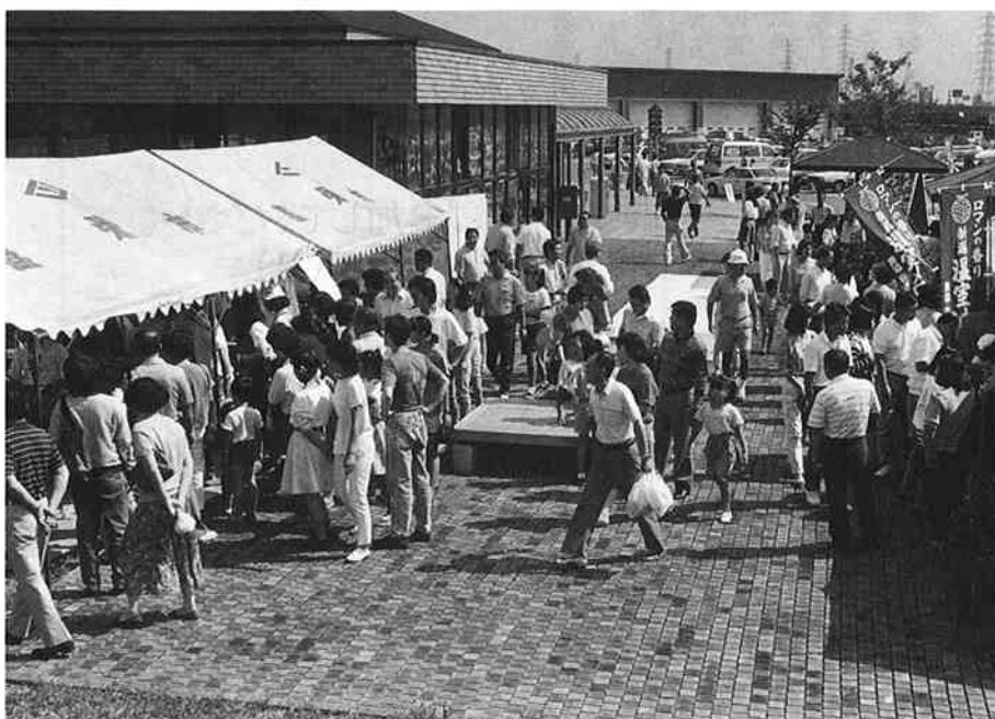
▲大勢の人でにぎわった会場