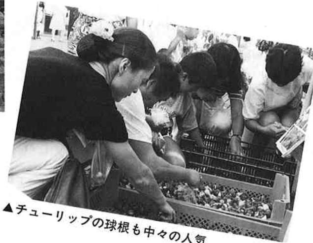
▲チューリップの球根も中々の人気

九月二十三日・二十四日豊栄フルーツフェスティバルが、豊栄パーキングエリアで行われました。これは、なし、ぶどう、メロンなどの豊栄の農産物を、広く県内外の人から知ってもらおうと行われたものです。会場には七千人の人が詰め掛け、「なしの皮むき競争」「ブドウの種とばし大会」などを楽しんでいました。また、おいしく安い農産物の即売会も行われ、好評を得ていました。