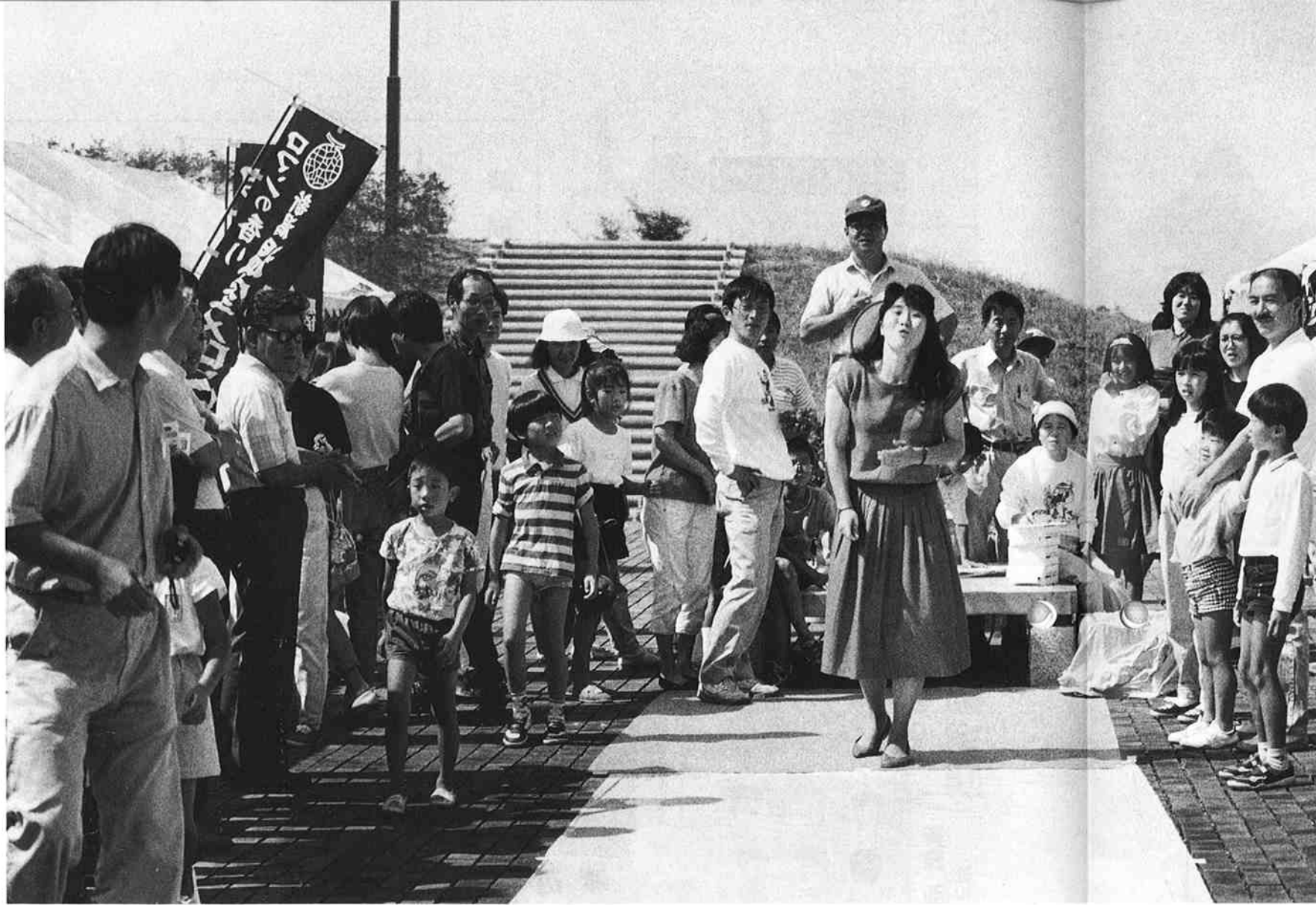
▲どこまでいったかな?(ブドウの種とばし大会)