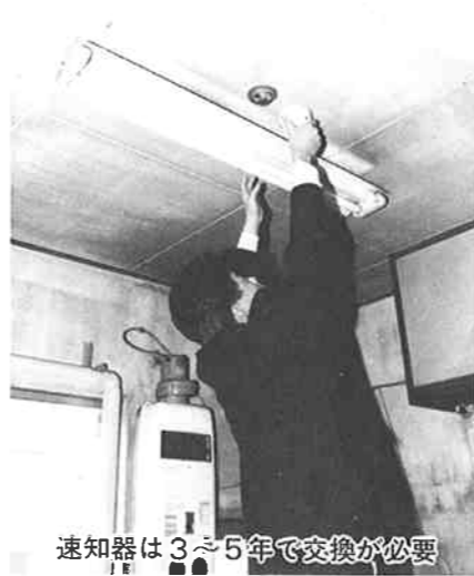
速知器は3〜5年で交換が必要

速知器の特長は、火災によって部屋の温度が上昇し、概ね摂氏八十四度になると、内蔵されている特殊薬品が反応し、警報音を出す仕組みになっています。