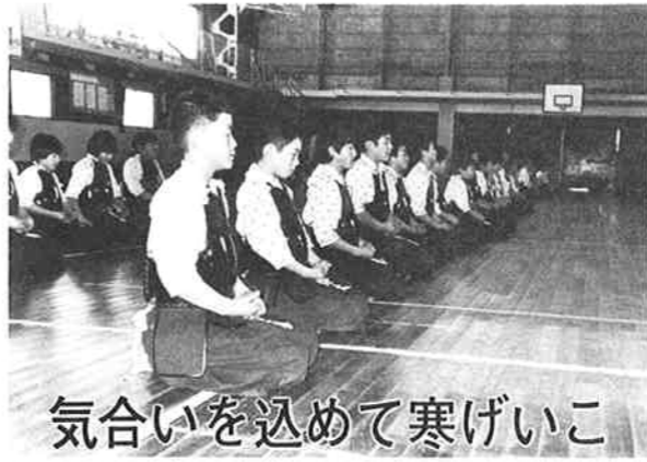
気合いを込めて寒げいこ

剣道教室の初げいこを兼ねた寒げいこが、二月四日、木崎小学校で行われました。この教室は、木崎地区公民館などの主催で数年前から開かれているもので、当日は小学生の男女七十人ほどが集まりました。吐く息も白く、体の中までしみとおるような寒さの中、参加した児童は礼儀正しく座り、黙とうをしながら精神を統一しました。気合いのこもったげいこが始まると、間もなくみんなは汗をにじませ、寒さを忘れていました。終わった後、ありのみ荘で役員のお母さん方から、愛情のこもったおしるこをいただき、寒げいこの幕を閉じました。