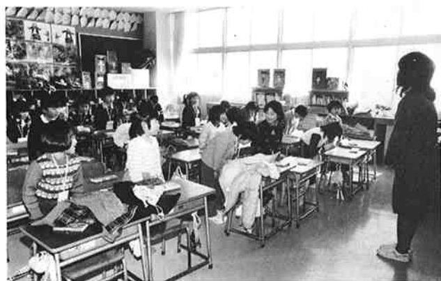
先生おはようございます。(葛塚小学校で)

市内の小・中学校では、県教育委員会から生徒指導推進地区の指定を受けたのを機会に、あいさつ運動をすすめることになりました。この推進地区の指定は、児童生徒の非行防止と健全育成を図るため設けられたもので、村上市と当市が二か年間の実践活動を委託されています。