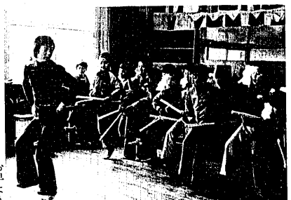
日曜日の早朝六時から、四つ切り舞いの練習にげも子供たち。たるは悪魔神三后八幡大方様より切り払う四方の神神。