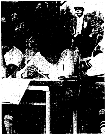
この問題、どうだったかな？ 学科問題に取り組む