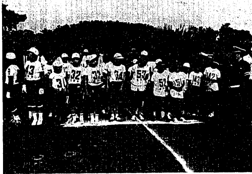
発表方法の説明に耳を傾ける児童ら

九月十九日、尾山ニュータウンの空地で「自転車の安全な乗り方発表会」が行われました。 交通安全の意識高揚を目的に、小学校高学年を対象にした同発表会には、市内十一校のうち八校が参加、各学校四人編成で、学科部門、実技部門に真剣に取り組んでいました。