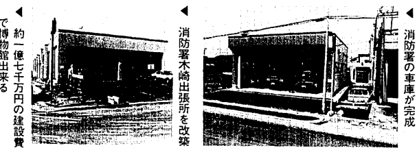
消防署の車庫が完成 約一億七千万円の建設費で博物館出来る