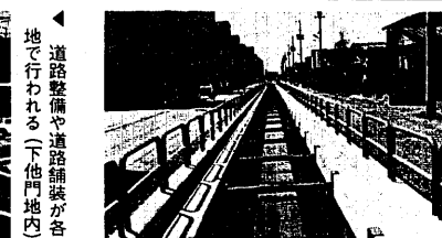
総工費約七千五百万円をかけ、早通下水路が完成。早通南にて