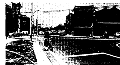
道路整備や道路舗装が各地で行われる(他門地区)