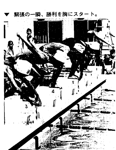
緊張の瞬間、勝利を胸にスタート。