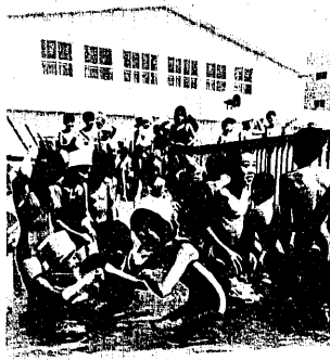
このタイムで間違いないですね、審判員の先生達も真剣。準備運動のあと、冷たい消毒槽に入る。