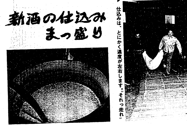
仕込みは、とにかく温度が左右します。それっわれ

市税の納付は 便利な振替納税で 市では昭和五十一年度から市税の口座振替納付制度を導入しました。年々この制度を利用する人が増加し、現在では五、四八三世帯がこの方法で市税を納めています。 この方法は、皆さんの預金口座から納期ごとに振替えますので、現金を持ち歩く必要もなく安全で便利です。ぜひ、振替納税制度をご利用ください。 取扱いの市税の範囲は、個人の市税、県民税、固定資産税、都市計画税、軽自動車税、国民健康保険税、国民健康保険料、新築田借入金庫、太陽信組の各豊栄支店と北越銀行豊栄支店、早通支店、市内の各農協同組合。 振替納税の申込み手続きは、「預金口座振替納付依頼書」に住所、氏名、口座番号、どうぞ。 口座名義人の氏名を記入し、預金口座に使用している印章を押印して、金融機関の窓口へ提出してください。用紙は金融機関の窓口にてあります。 市税の納付計画は、固定資産税、都市計画税、軽自動車税(全期分)は五月、市民税、県民税は六月、国民健康保険税については五月(仮定)、九月(本算定)のいずれも中旬ごろそれぞれ「納期」(納期)「納期」をそれぞれお知らせします。それにもついで納付計画をたてて指定口座へ預金してください。 「振替納税制度」についてのお問い合わせは、課税課係七—三〇—内線二四〇へどうぞ。