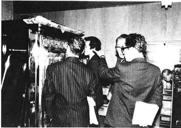
△ 国 の 伝 統 的 工 芸 品 の 指 定 を 申 請 し て い る 豊 栄 仏 壇 。 通 産 省 か ら 係 官 が 現 地 調 査 に 来 市 ( 十 二 月 二 十 六 日 )