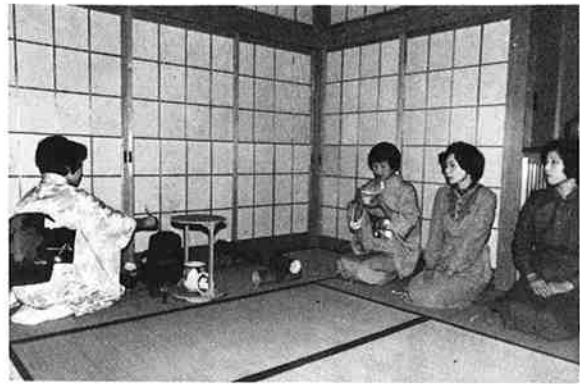
宗 儒 流 の 初 釜 が 開 か れ ま し 了 ( 一 月 六 日 、 中 央 公 民 館 )