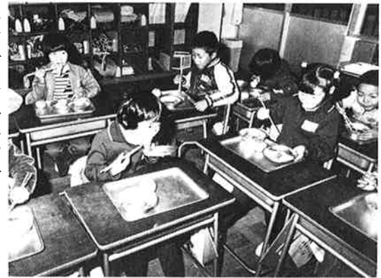
▷ み ん な で つ い て 、 み ん な で 食 べ た 太 田 小 の モ チ ツ キ 大 会