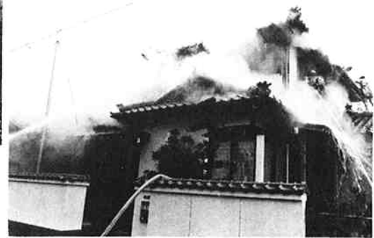
暮 れ の 十 二 月 二 十 六 日 、 ス ト ー プ △ の 不 始 末 で 火 事 発 生 ( 朝 日 町 )