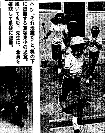
△▷ それ地震だ、と机の下に避難する葛塚東小の児童。続いて火災、先生は、全員を確認して最後に避難。