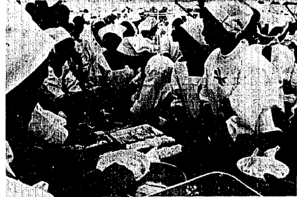
▽ 本町通りの商店街では、自衛消防隊が活躍

割当面積は、昨年比で一、六〇ア増加しました。特定作物の転作は、昨年比で五〇・八ア減少しました。大豆が一、三三五ア、麦が二九二ア減少したことなどにより、これに対して飼料用青刈は一、〇五六ア増加しました。