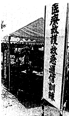
▷ 医師会の救護訓練と無線による救急通信訓練。日赤の救護訓練や血液の輸送訓練も行われました。