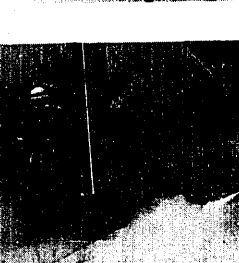
▽ 早通団地で救助訓練をする消防署員