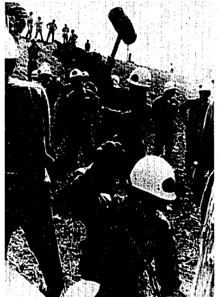
▽ 胡崎山では、消防団による水防訓練が行われました。