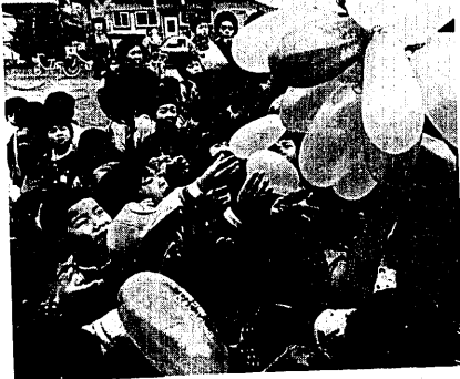
△ 交通指導隊長と共に早通保育園を訪問。「曲がりかどいつもきげんがかかると、と標語を言いながら風船を渡す(上)」「おねえちゃん、ボクにもちょうだい」と小さい手がいっぱい(下)