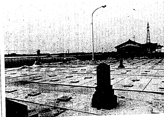
整備された下大谷内の共同墓地

の火葬場跡を墓地にしたい」という声があり、昨年共同墓地建設委員（十人）を構成し、具体的検討に入っていたものでした。