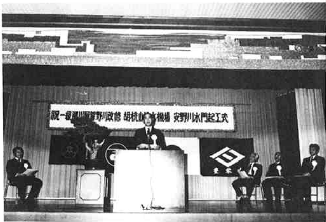
△ 全市民念願の胡桃山排水機場の建設が決まり、喜びの起工式で謝辞を述べる市長（中央公民館）

▽ 昭和五十二年四月号から掲載した「みんぐ」は本号で幕を閉じます。二年間にわたり取材等でご協力をいただきありがとうございました。 ▽ 替わって次号から市内の「橋あれこれ」（仮題）を企画しています。 由緒ある橋、変わった橋、思い出のある橋など、どんなことでも結構です。係までお知らせください。