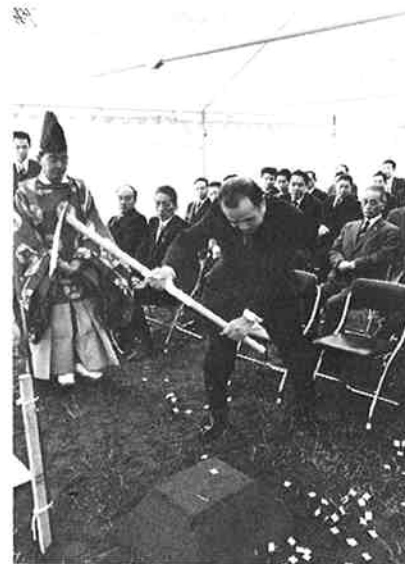
△ 木崎小学校改築の地鎮祭が行われました。鉄入れする市長。