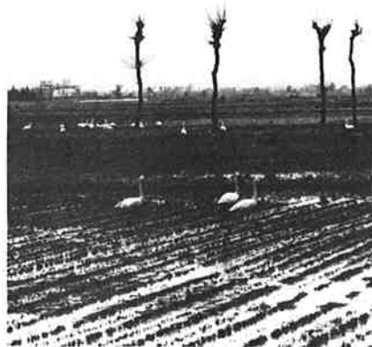
△ シベリア方面への帰行を前に、えさをついばむ白鳥の群れ（大瀬柳地内）