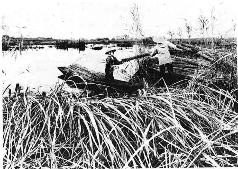
▲季節の風物詩、福島潟のヨシ刈り 雪がくる前に、ヨシを刈ってしまわなければならぬ。不順な天候の続く十二月、潟では、冬用のヨシ刈りが急ピッチで行われています。