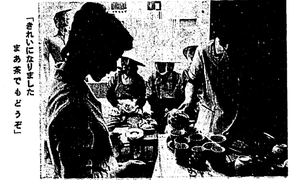
「きれいになりました まあ茶でもどうぞ」