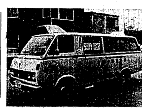
大田小学校の建設着手

大型救急車を購入 消防本部に新式の大形救急車が、備え付けられました。この救急車は、定員十人で七人の患者を輸送できます。また、これには二入用の酸素発生装置、骨折事故に体力を発揮するマジックギンズ、油圧式救助器具などが装備されています。