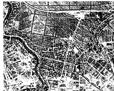
白新線全通当時の空から見た市街地