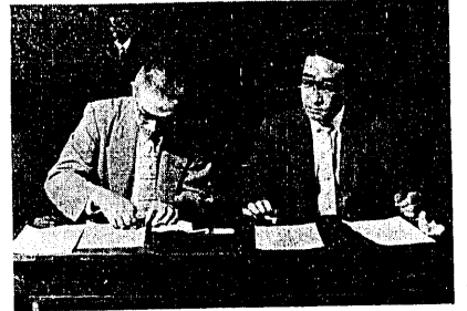
長浦村との合併調印式