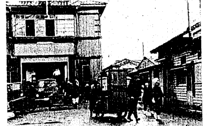
住みなれた役場の引越し