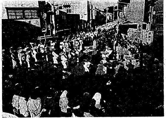
500人の踊り手と見物人でにぎわった民謡流し

豊栄市は、市は、北海道恵庭市・栃木県県下で二十一番めに市制を施行した。これは、一日現在の市の数にありますが、五百八十八になりました。人口の大きさが、自治大臣の告示の順序からすると、豊栄市は、五百八十七番の市になります。 また、市制施行を申請中の市と同じく十一月一日に市制を施行した