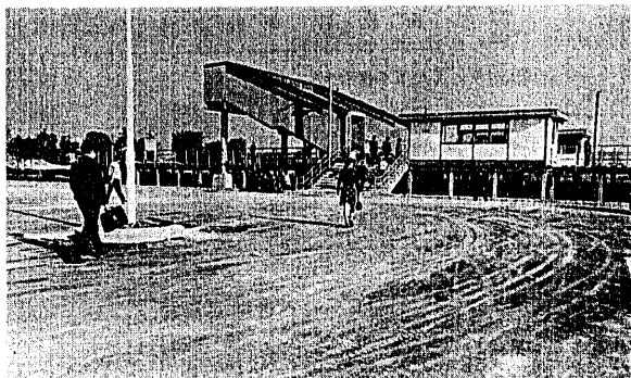
移転して新装なった早通駅