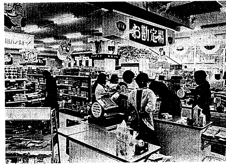
大型化してきた商店