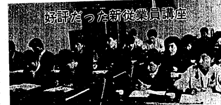
好評だった新従業員講座

止してはどうかと、婦人団体などから意見がでています。しかし、個人の自由意志を制限するのは適当でない。新しい時代の青年は、もっと自主性をもち、自らの判断で必要な金は使わないというところが必要です。今回そうしたことの参考として、服装に関する実態調査をしました。この結果につきある人はこういっています。和服と洋服との着用者を、地域別、学歴別、職業別に分類して判断すると、家族も本人も、人間的価値に重きをおく場合は服装を飾らない。内容のない人間だから、せめて外見を飾ろうとする者が、高い金をかけて和服にするのだというのです。いさか醜態のきらひはありますが、明らかにそうした傾向はあるようです。明年の担当者は、こうしたことも考慮して、金に困らない者もむだな支出はせず、金に困る者も儲かるとなく、前出の通り、服装を飾るというようになつてほしいものです。