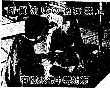
阿賀川流域の漁獲禁止

阿賀川流域で発生した有機水銀中毒(水俣病)について 阿賀川流域で発生した有機水銀中毒(水俣病)について、町民の健康被害の発生状況は次の通りです。 死者 28人、入院者 1人、合算 29人 また、県の管内にわたって阿賀川流域の各部落(高森、高森、新田、森下、三ツ尻、胡麻山、兄弟堀、太子、大迎、灰塚、長戸、呂の一部)で有機水銀中毒に對する説明会を開催し、手配やつめの採りまわっています。