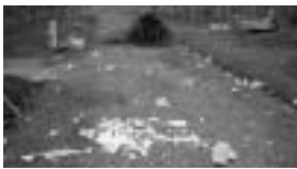
農道などに捨てられたごみ(上:三津屋、下:新町)