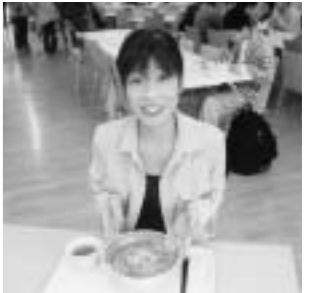
安くておいしい学食です。

—研究以外で、はまっているものや趣味はありますか？ 新潟に来てからは、暇を見つけてはよくスキーに行っています。学生のころは、二五〇ccのバイクに乗ったり、ガレージセールで安く部品を買ってきて、友だちと一緒にいじったりするのが好きでした。 —今、研究者としての夢・目標は何ですか？ 現代の医学で治療が難しい病気のひとつは、何らかの形で遺伝子の異常が関係しているといわれています。私は、それらの病気に関わる遺伝子を見つけ、治療の礎となるような研究を行っていったら、と考えています。 —地域の皆さんには、地域交流講座などに参加していただいてもっと身近にお付き合いできたらうれしいです。