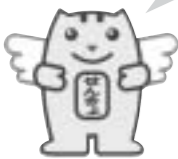
明るい選挙のイメージキャラクター「めいすいくん」

選挙に関する問い合わせは… 市選挙管理委員会 (☎24 - 2111 内線301)へ。