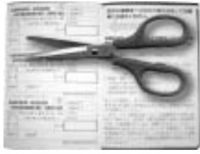
1枚に家族3名まで記載されます。

①郵送された入場券のうち、自分の氏名の記載されている部分を切り離して、指定された投票所へ行きます。