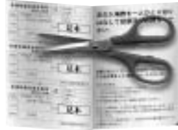
1枚に家族3名まで記載されます。

①郵送された入場券のうち、自分の氏名の記載されている部分を切り離して、指定された投票所へ行きます。