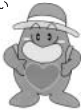
新潟県の献血キャラクター ブラッドくん

「献血って、してみたいけど、ちょっと恐いし病気に感染したりしないの？」 そんな不安や疑問にお答えします。