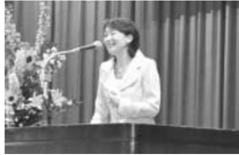
*アグネス・チャンさんの講演の内容は、介護保険季刊紙「きらっTo」6月1日号をご覧ください。

5月9日、市民会館大ホールで「新津市健康講演会」が行われ、歌手でユニセフの大使を務めているアグネス・チャンさんが講演。約1,600人の入場者を前に、故郷の中国での健康法や、世界の人々の健康の現状、「食」の大切さを、ユーモアたっぷりに語りました。