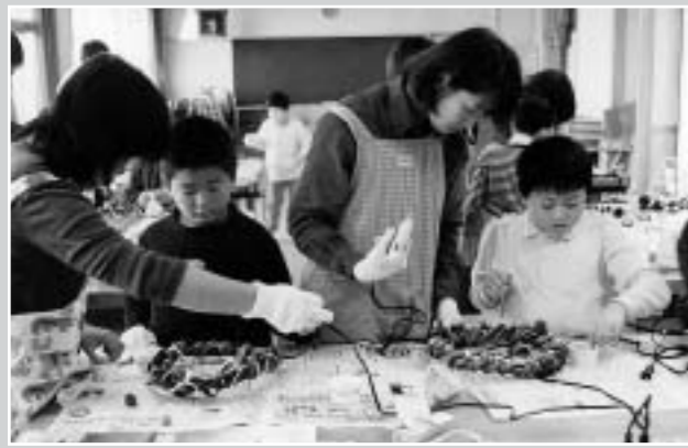
教育ボランティアの協力による「親子PTA行事(リース作り)」