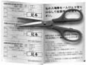
1枚に家族3名まで記載されます。

①郵送された入場券のうち、自分の氏名の記載されている部分を切り離して、指定された投票所へ行きます。