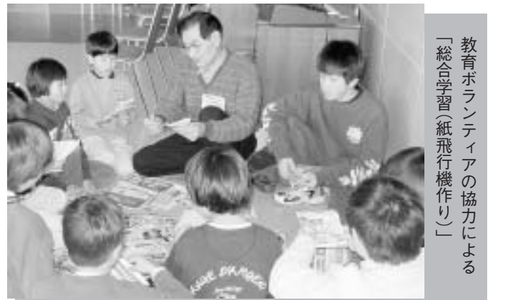
教育ボランティアの協力による「総合学習(紙飛行機作り)」

平成15年度の学校教育ボランティアを募集します 教育委員会では、今年度も学校教育ボランティア活動に参加いただける人を募集します。各幼稚園や小学校、中学校では、下のような活動に応援をいただける人を求めています。