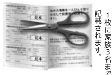
1枚に家族3名まで記載されます。

①郵送された入場券のうち、自分の氏名の記載されている部分を切り離して、指定された投票所へ行きます。