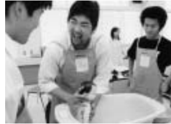
好評! 赤ちゃん沐浴実習(1月31日、新津工業高校)

市からののお知らせは、ラジオチャットで毎週月曜～金曜日の午後3時から放送中の CHAT COM COM CITY (チャットコムコムシティ)で!