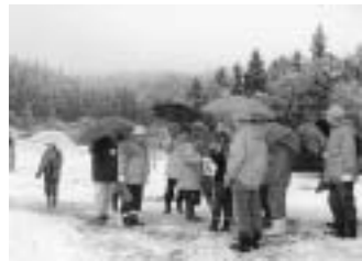
雪の降りしきり中の市民大学の学習風景(11月5日長岡市雪国植物園)