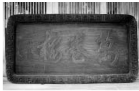
萬巻楼の額 書庫の入り口に掲げられた木額

萬巻楼の聯(れん) 入り口の両側に下げられたもので、右は「日月両輪天地眼」、左は「詩書萬巻聖賢心」と書かれています。