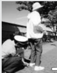
夕暮れ時、ドライバーは早めにライトを点灯しましょう。