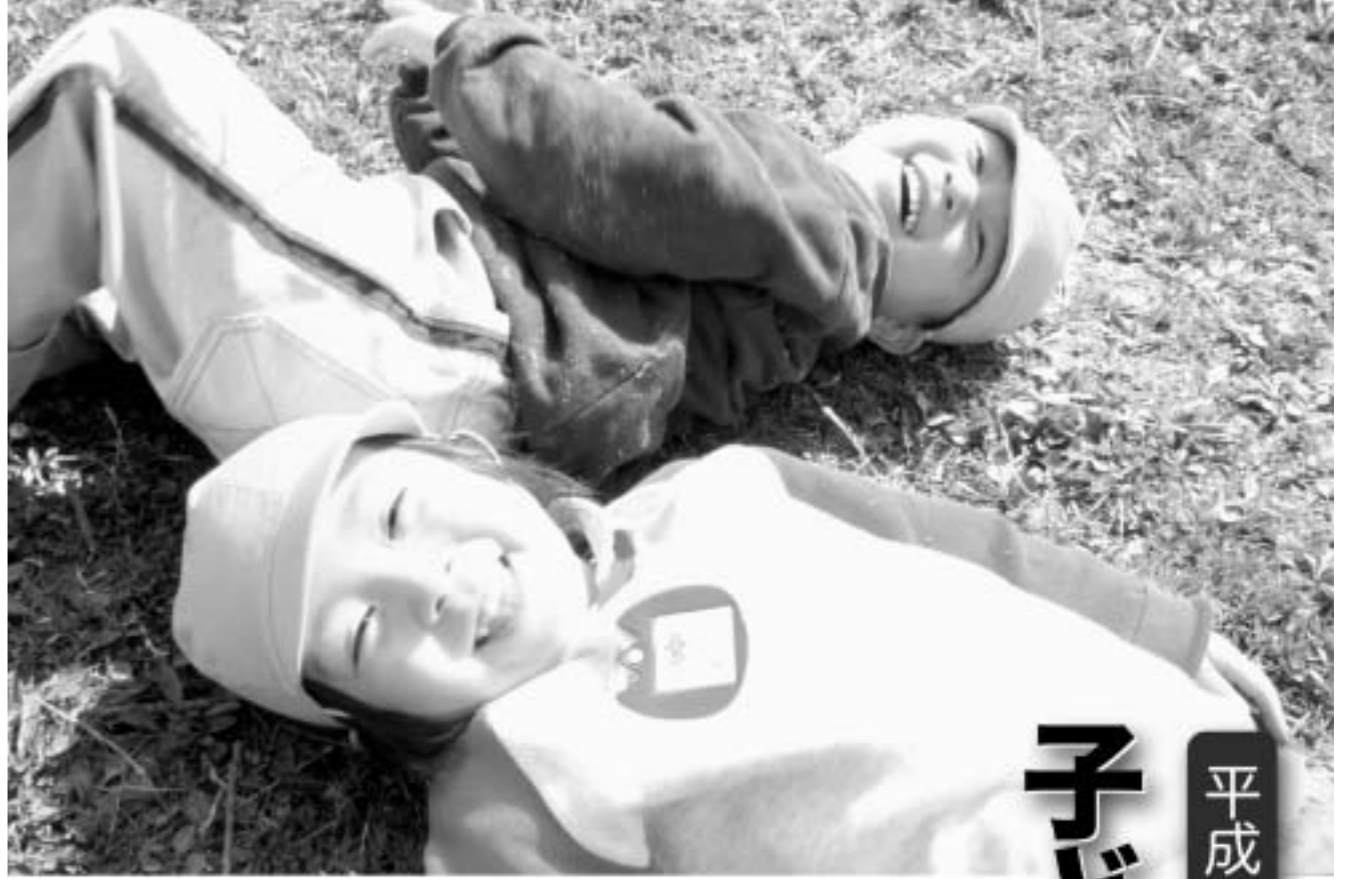
ともだちと一緒になら、なんでも楽しいね。