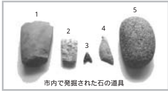
市内で発掘された石の道具