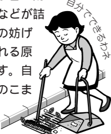
自分でできる水害対策

雨水まずにごみなどが詰まっていると排水の妨げとなり、水があふれる原因の一つとなります。自宅周辺の雨水ますのこまめな清掃にご協力ください。