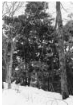
冬の雑木林に際立つ 緑のカシの木

雑木林をそのまま自然の遷移にゆだねれば、もともと丘陵を覆っていたカシ類の常緑樹の森に変わっていくものと考えられます。もちろん百年単位の時間スケールでの話ですが、冬の雑木林で目立ってきた緑は、その兆候とも見て取れます。元の自然の姿に戻るのだからよいとの声も聞かれますが、季節の移ろいを多彩な表情で告げる落葉樹主体の今の雑木林は、私たちの先人が二千年もの長い年月をかけてつくりだし、守り継いできた独特な里山の生態系なのです。