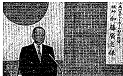
V33の総代工業高校監督が講演(12月1日、スポーツ振興大会)

INTERNET http://www.city.niitsu.niigata.jp/