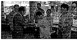
↑代表して新栄学園に手渡された