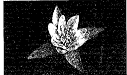
市役所の「つじぎき」も咲いたよ (8月29日撮影)

INTERNET → http://www.city.niitsu.niigata.jp/