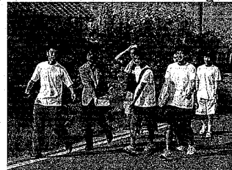
歩いて運んだ石炭は約20kg！

8月5日、JR新津運輸区に福島県いわき市の県立内郷高校の生徒17名が、かつて地元で采えた常盤炭坑の石炭をSL「ばんえつ物語」号にプレゼントしようと、徒歩リレーで石炭を届けられました。