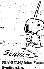
PEANUTS®/United Feature Syndicate, Inc.

新津市美術館 ☎25-1301 http://www.city.niitsu.niigata.jp/