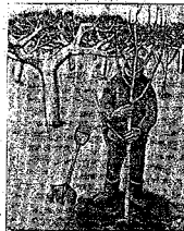
田木植久(制作年不明)